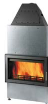
Krbová vložka Novara